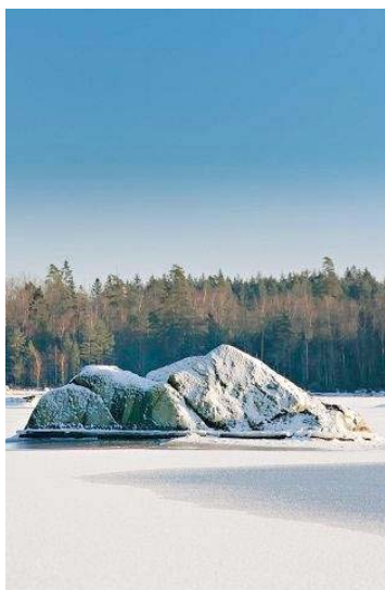
Brudehall, en klippa i södra delen av Osbysjön som har en egen historia.